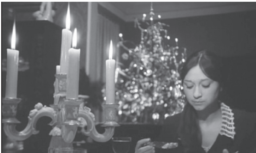
Il. 2. Palacz zwłok. Kolacja wigilijna kojarzy się Kopfrkinglowi z żalobnym obrzędem, co podkreśla wyeksponowany w kadrze świecznik

mówi przy stole wigilijnym: „Teraz to naprawdę mamy Boże Narodzenie. Tym razem świece są w domu. Zazwyczaj stawiam je na katafalkach i na grobach”. Świece, symbolizujące między innymi ofiarę i kult zmarłych 32 , kojarzą się bohaterowi z krematorium i śmiercią. Podczas kolacji wigilijnej domownicy pokazywani są pojedynczo w półzblizeniach w ten sposób, że w prawie każdym z ujęć 33 większą część kadru zajmuje świecznik (il. 2). Takie kadrowanie jest z pewnością nieprzypadkowe. Obserwując pojawiające się kilkakrotnie plany ogólne, można wywnioskować, że świecznik stoi dość daleko od Lakme, tymczasem w ujęciu pokazującym kobietę w półzblizeniu wygląda na to, jakby znajdował się tuż obok niej. Kadrowanie oddaje skojarzenia bohatera, który, prawdopodobnie jeszcze nieświadomie, zaczyna snuć fantazję o śmierci i złożeniu rodziny „w ofierze”. Co znamienne, świecznik widoczny jest także w ujęciu ze śpiewającym kantorem, w scenie, w której Kopfrkingl udaje się na spotkanie żydowskiego bractwa pogrzebowego.