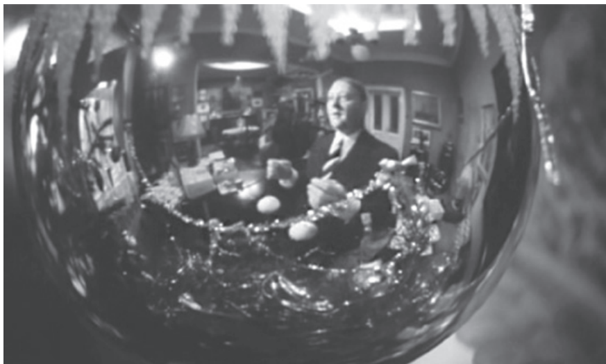
Il. 1. Palacz zwłok. Zabieg operatorski sprawia, że przestrzeń mieszczańskiego domu jawi się jako zdeformowana, co jest motywowane pogłębiającą się psychozą bohatera

stans pomiędzy przedmiotami – zniekształcony. Sielankowa wizja domu oraz życia rodzinnego, która znajdowała wyraz w kompozycji niektórych wcześniejszych kadrów, zostaje całkowicie zaburzona. Można przyjąć, że jest to zapośredniczona fokalizacja bohatera, który coraz bardziej oddaje się swoim mrocznym pragnieniom. Kopfrkingl przestaje spełniać się w roli męża i ojca, a jego percepcja rodziny zaczyna się zmieniać.